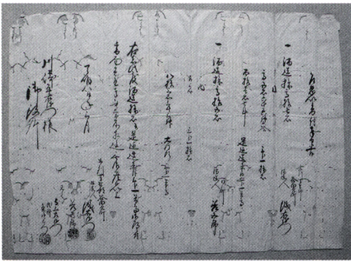
写真1 乍恐以書付ヲ奉申上候 (No.157) (酒造株石3分の1米高書上届)

二宮町久下田の吉村家は、近江国蒲生郡小谷村（現・滋賀県日野町）出身の商人で、家伝によれば享保二十年（一七三三）に芳賀郡谷田貝町（現・久下田町）に店を構え、寛延二年（一七四九）から酒造業を開始しました。もう一つの家業である質商と併せて、江戸時代後期には大きく発展し、谷田貝町を代表する豪商の地位を確立しています。明治以降も、世襲の儀兵衛を名乗り、酒造業とともに谷田貝郵便局長も勤めました。それらの古文書類二、六〇一点が本館に寄託されています。