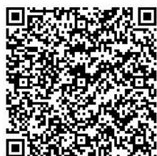
(申込み QR コード)

左記の QR コードを読み取っていただくか、下記の参加申込みアドレスにより「栃木県電子申請システム」サイトに接続し情報を入力してください。また、安足教育事務所ホームページトップページ 新着情報 にリンクを貼ってあります。パソコンからお申込みの方はご利用ください。お申込みは1月13日(火)までお願いいたします。