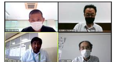
ブレイクアウトルームによる情報交換