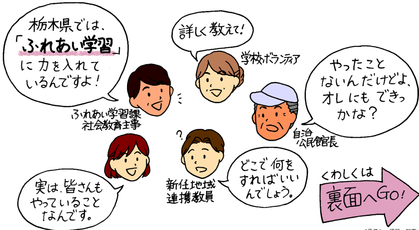
イラスト 伊藤 知恵