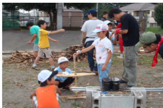
【陽光小学校でのキャンプ~まずは火おこしから~】