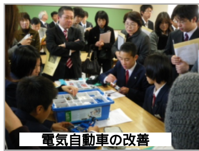
電気自動車の改善