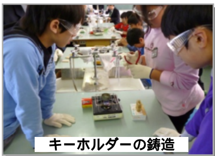
キーホルダーの鑄造

小学校では、「鑄造でキーホルダーを作ろう」（6年生）などの巧緻性を育む授業が展開され、また中学校では、「電気自動車を走らせよう」（1年生）などの創造性を育む授業が展開されています。11月25日には研究開発の中間発表会があり、ものづくりの教育的な効果が改めて示されました。