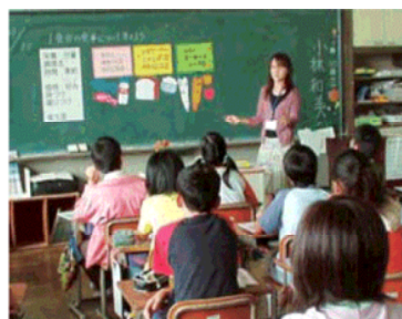
（食に関する授業 「とちぎの食育 元気プラン」から引用）