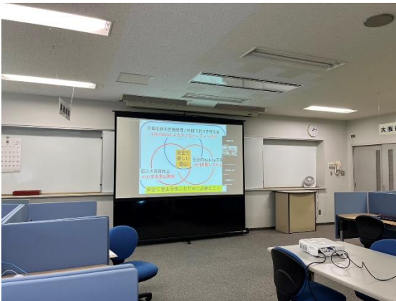
○講義1 「プランニングとチーミング」の様子