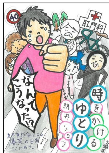
R5 最優秀賞受賞作品