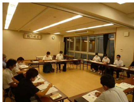
生徒会役員も参加した連携会議

連携会議には生徒会役員も出席し、活動の具体策について話し合いを行うことで、参加した委員から多くのアドバイスが得られた。また、学校運営協議会の協力で、町民に働きかける機会を持つことができた。