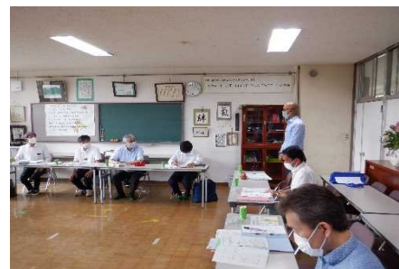
モデル校での連携会議

学校や地域学校協働本部が「何ができるか」という議論ではなく、「何がしたいか」という議論をしていくことの必要性を理解した。