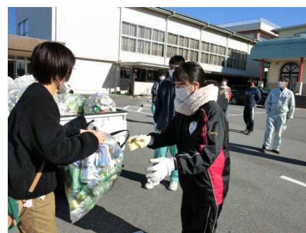
PTA役員とのアルミ缶回収

生徒が「プロジェクトH」に主体的に取り組み、地域の様々な人たちと連携・協働することで、コロナ禍でもつながりづくりを進めることができた。