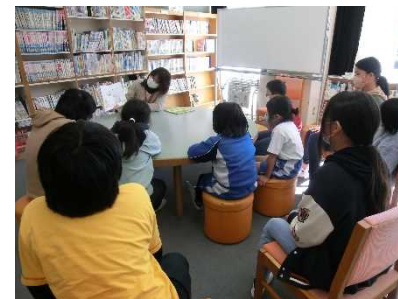
読み聞かせの様子

地域住民のボランティア志向や、地域の子どもは自分たちで育んでいこうという意識の高揚が見られた。