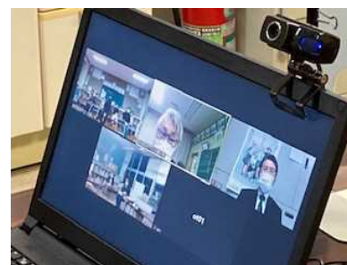
研修「閉校後の可能性を探る」 (web 会議ツールを活用)

また、学校統合により地域との連携・協働関係を再構築した山形県小国町の事例から、「閉校後の可能性を探る」ことができた。