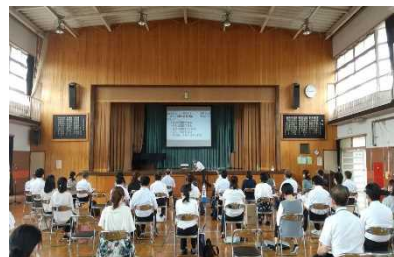
教職員対象の研修

会議をとおして、地域が学校の方針を理解して教育活動を支援することの大切さ等を確認することができた。また、研修をとおして、協議会の役割や意義等について理解を深めることができた。