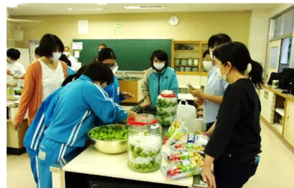
梅と氷砂糖の漬け込み

上三川中学校ならではの取組を周知したことにより、「地域学校協働活動」に対して関心を持つ地域の人が増えた。