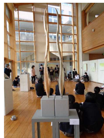
オープンスクール （芸術家による鑑賞授業・現中学校）

それによりコミュニティ・スクール導入に関する意識の醸成が図られた。また、事務局によって、「AWANO 夢咲くアートフェスティバル」についてのホームページを公開し、地域住民の郷土愛の高まりにも寄与することができた。