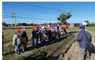
ふるさと学習の様子

子どもたちのふるさとを大切にする心情を育むとともに、地域住民の協働活動支援の輪が広がり、より深い地域理解が得られた。