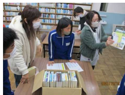
ボランティアとの新刊本の受入れ作業

自己紹介を行うとともに、お互いがどのような活動をしているか発表し合うことで、理解を深めた。和やかな雰囲気の中で、今後やってみたいことを挙げたり、新刊本の受入れ作業を一緒に行ったりすることができた。