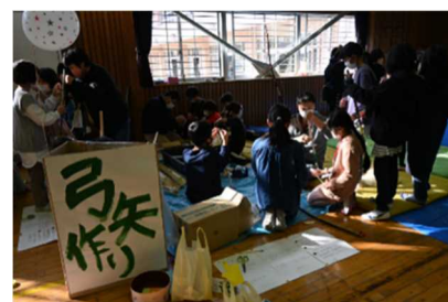
オータムスクール （弓矢作り）