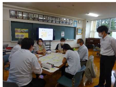
モデル校での研修の様子

熟議では、共有したビジョンの実現に向けて、課題を明らかにして具体的な行動を考えることにより、参加者の当事者意識を高めた。