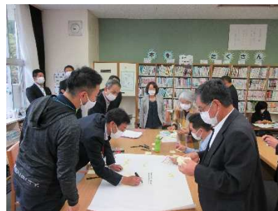
連携会議（熟議）の様子

熟議の有効性を認識するとともに、地域と学校の双方向の関係づくりの重要性について共通理解を図ることができた。