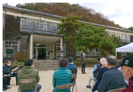
AWANO 夢咲くアートフェスティバル （開会行事・旧栗野中学校前）