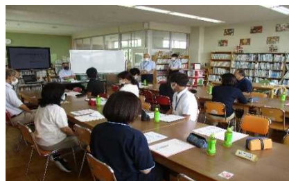
モデル事業実践校での研修

教職員、関係者の協働活動への理解が進むとともに、新たな地域人材や地域資源の拡充につながった。