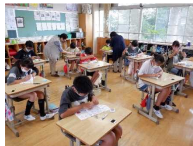
5年生 家庭科 手縫いの補助

地域コーディネーターを介して、学校支援ボランティアによる「読み聞かせ」「生活科の町探検の補助」「家庭科のミシン・手縫いの補助」「吹奏楽部の指導」を実施し、地域の教育力を活用した教育活動の重要性を再確認できた。