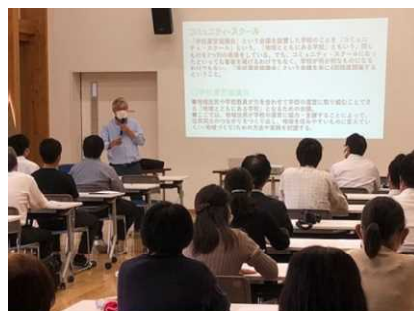
様々な立場の方が参加した研修会

研修会には、町内各小学校や学校支援ボランティア、PTA役員など多くの関係者が参加した。「地域で子どもを育てることや、子どもの教育に関わることの大切さが分かった」など、地域連携に向けての意識を高めることができた。