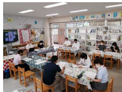
連携推進会議の様子

地域と学校がパートナーとして連携するための方策や、「協働」について共通理解を図ることができた。