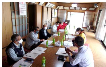
市貝町観音山協議会からの聞き取り

梅ジュースの効果的な活用を図るため、専門家からの聞き取りを行った。さらに、学校支援コーディネーターのネットワーク等を利用したことにより、本活動に関わる地域のボランティアが増えた。