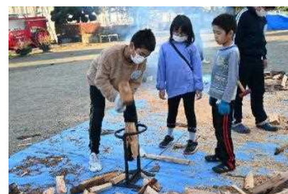
防災訓練キャンプ （薪割り）

めざす学校像やコロナ禍に負けず地域の方々で行った様々な教育活動をホームページで発信したり、PTA及び地域の方々、地域教育協議会委員や公民館へ、広報紙を配布したりした。学校運営協議会への理解が深まり、地域学校協働活動に対し、意識の高揚が図られた。