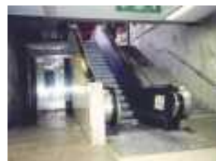
⑥駅のホームへの昇り口