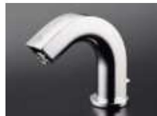
③自動水栓 (トイレの蛇口)