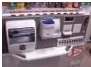
②自動販売機の コイン投入口