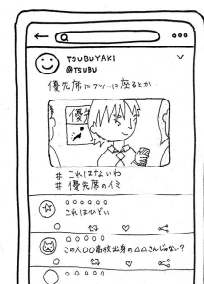
資料②「SNS への書き込み」