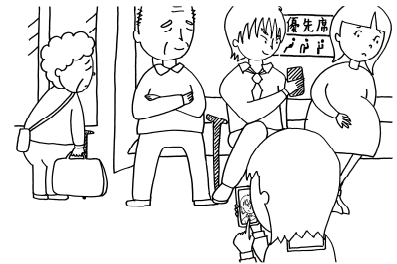
ワークシート①の場面A「電車内の様子」