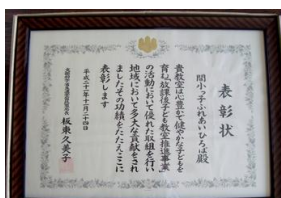
昨年文科省の表彰を受けました