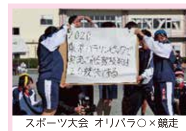
スポーツ大会 オリパラ〇×競走