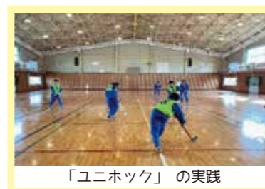
「ユニホック」の実践