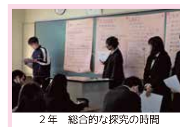
2年 総合的な探究の時間