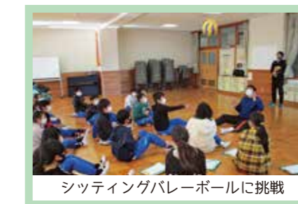
シッティングバレーボールに挑戦