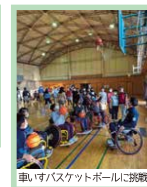
車いすバスケットボールに挑戦