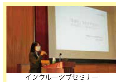
インクルーシブセミナー