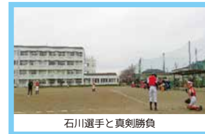
石川選手と真剣勝負