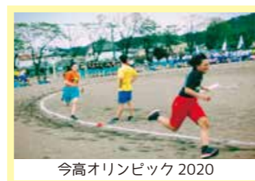
今高オリンピック2020