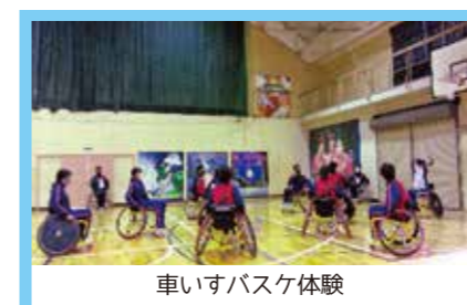
車いすバスケット体験