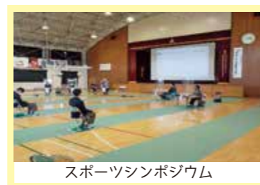
スポーツシンポジウム