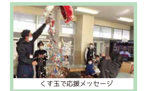
くす玉で応援メッセージ