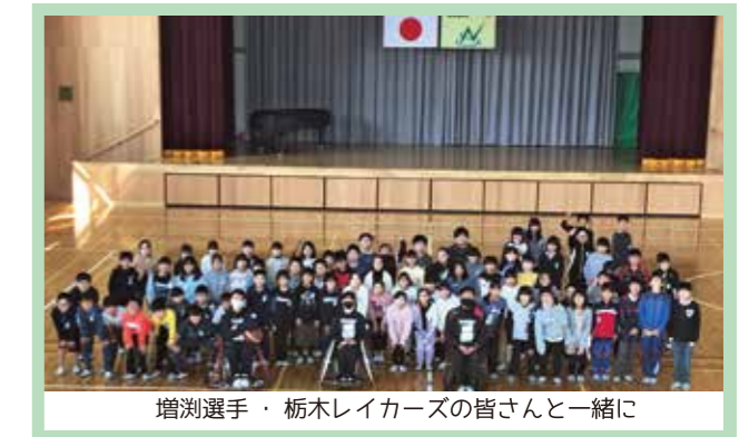
増測選手・栃木レイカースの皆さんと一緒に