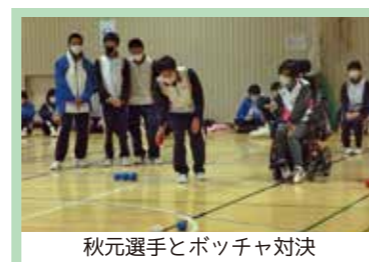
秋元選手とボッチャ対決