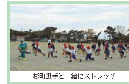
杉町選手と一緒にストレッチ