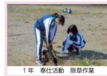
1年 奉仕活動 除草作業