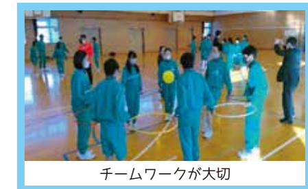
チームワークが大切