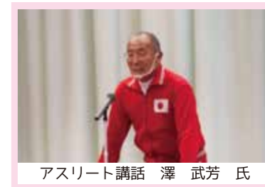
アスリート講話 澤 武芳 氏