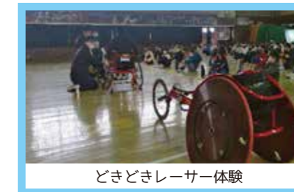
どきどきレーサー体験