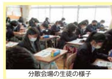
分散会場の生徒の様子