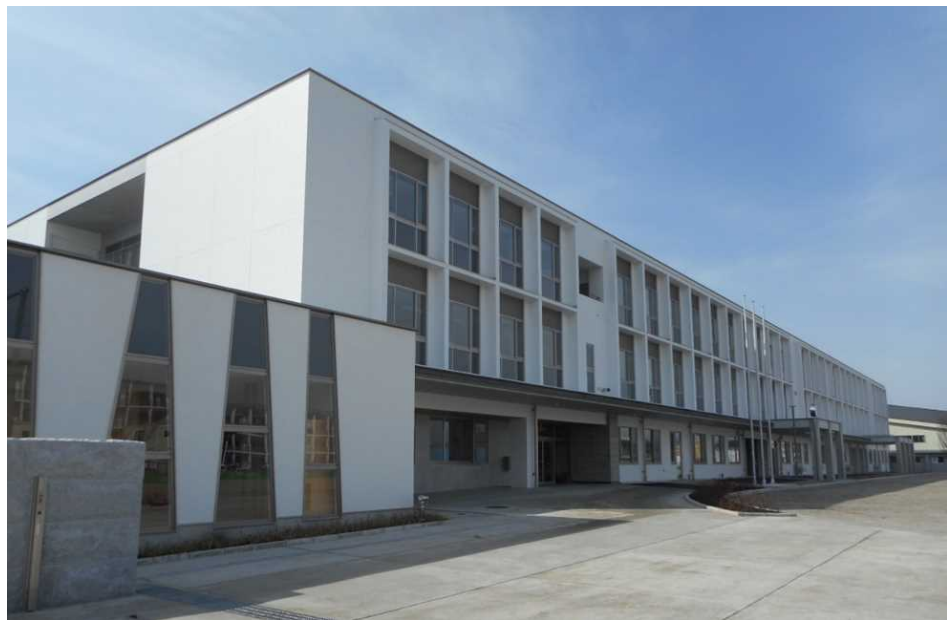
管理教室棟 外観(北東から撮影)