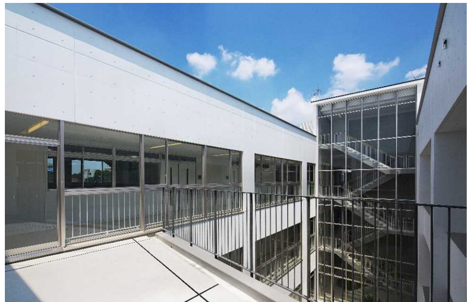
管理教室棟 3階テラス