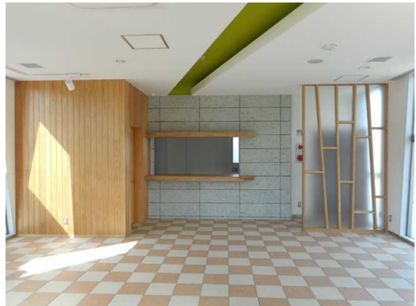
コミュニティショップ 内観