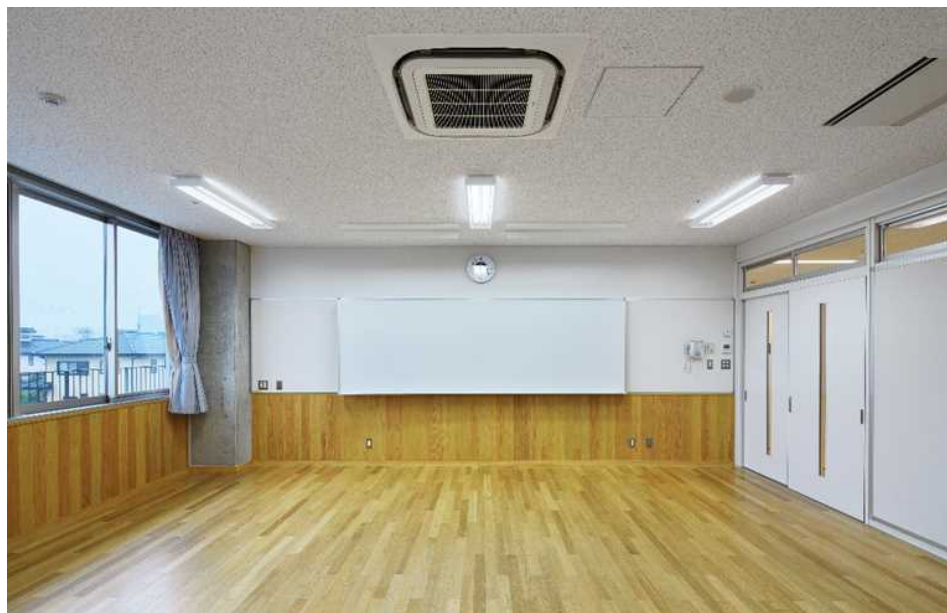
管理教室棟 普通教室