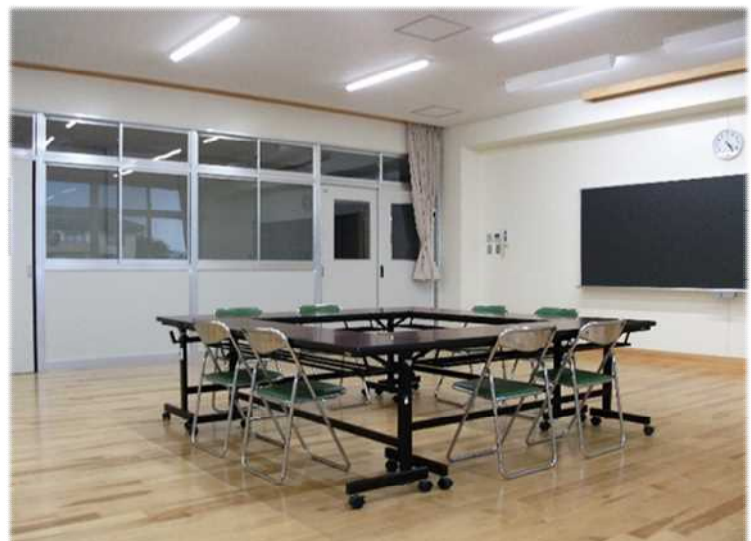
増築校舎 1階 教育相談室