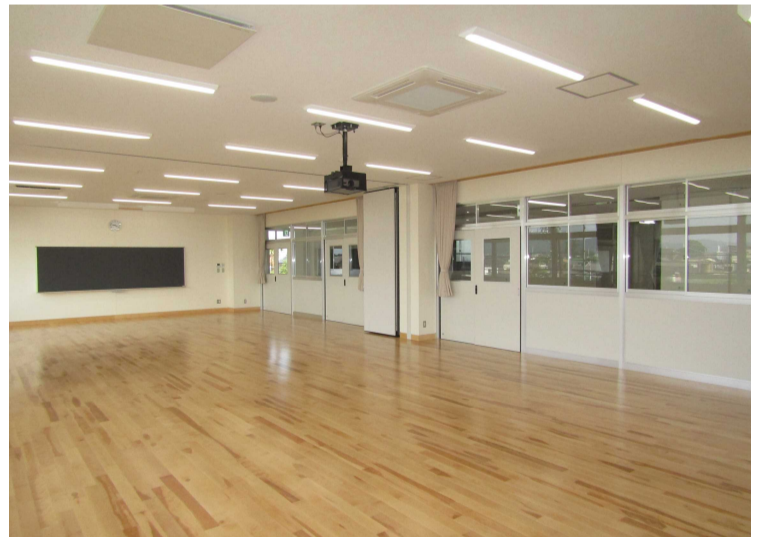
増築校舎 2階 多目的室