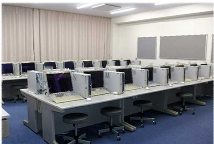
増築校舎 1階 コンピューター教室