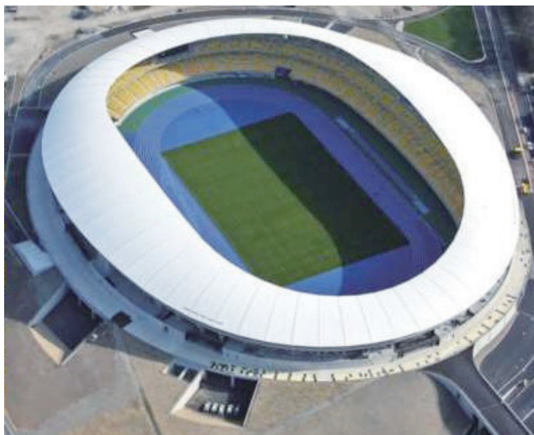
カンセキスタジアムとちぎ（栃木県総合運動公園陸上競技場）