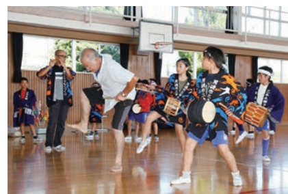
地域の教育資源を活用した教育活動 (地域の保存会による伝統芸能の伝承)