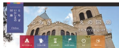
「とちぎいにしえの回廊」 ホームページ