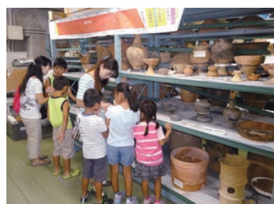
埋蔵文化財センター施設見学