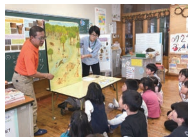
埋蔵文化財センター出前授業