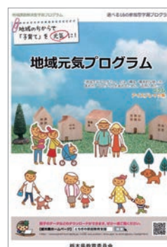
地域課題解決型学習プログラム (地域元気プログラム)