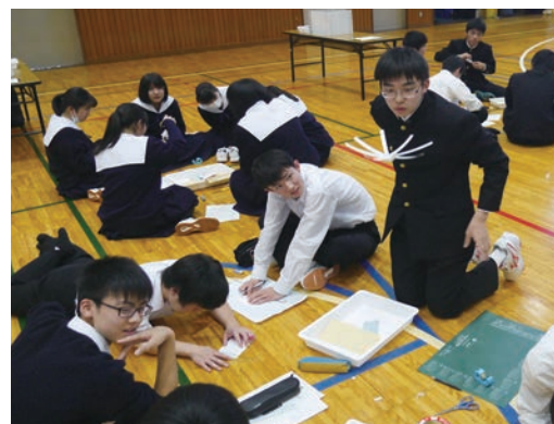
科学の甲子園 栃木県大会の取組