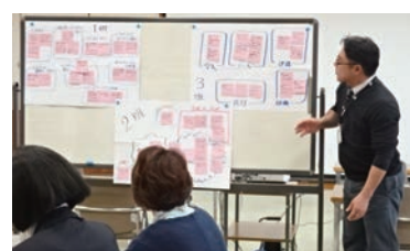
地域コーディネーター養成研修