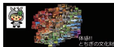
フェイスブック「体感!!とちぎの文化財」