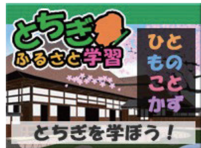
とちぎふるさと学習のホームページ