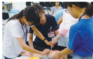
とちぎ子どもの未来創造大学 (医師・看護師の模擬体験)