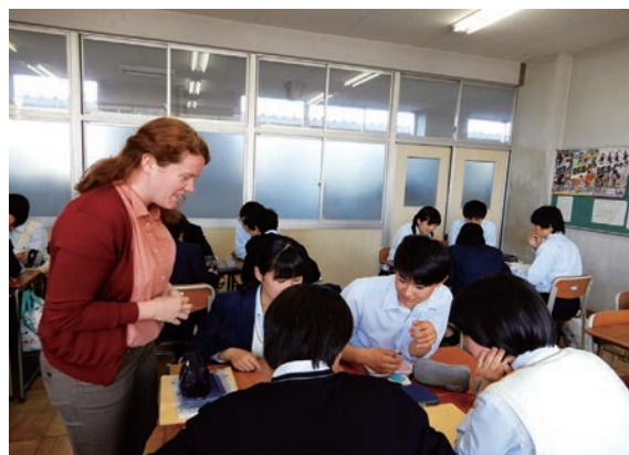
外国語指導助手を活用した授業風景