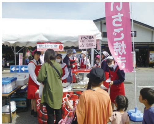
地元自治体・企業等と連携・協働した取組