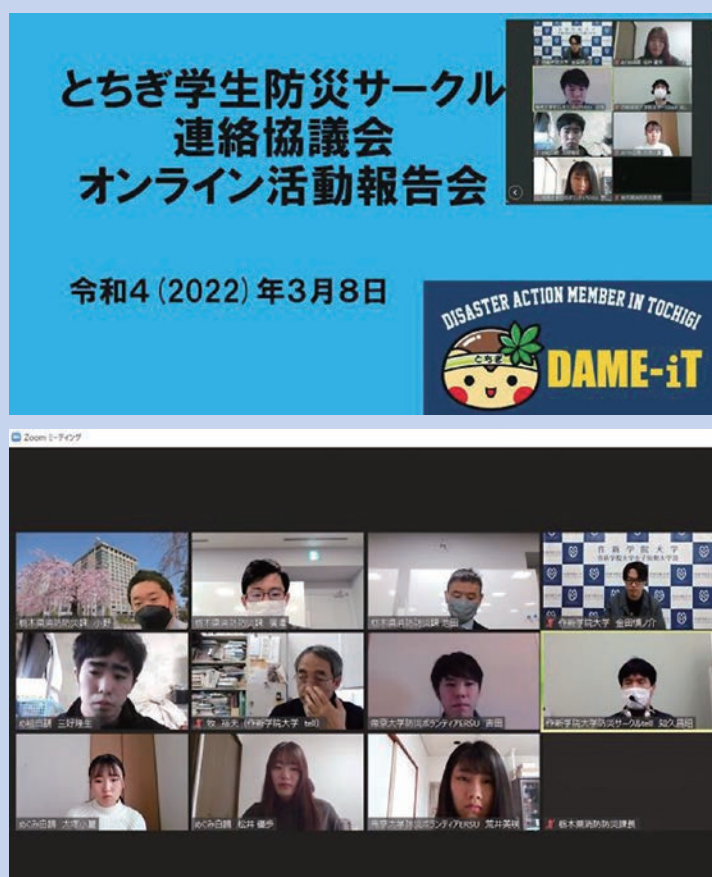
令和3（2021）年度とちぎ学生防災サークル支援事業 『活動報告会』（R4.3.8オンライン開催）

栃木県県民生活部消防防災課 （公財）栃木県消防協会 令和4（2022）年3月発行