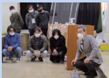
防災士養成研修講座の様子