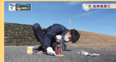
防災ボランティア ERSU 「空き缶ご飯の作り方」