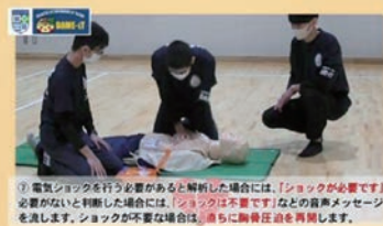
め組白鷗 「AEDの使い方講習」