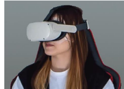
VRゴーグルの装着例