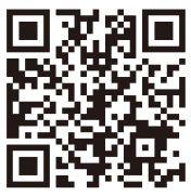
申し込みフォームはこちら!

簡単!今すぐ! 右のQRコードから お申し込みが可能です>>>> その他、HPに記載された登録申請書に必要な事項を記載し、電子メールまたはFAXで栃木県消防防災課に申請する方法もございます。 ※不明な点がありましたら、裏面の連絡先までお問い合わせください。