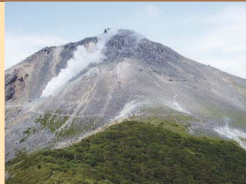
■ 那須岳の火山活動について 1408年から1410年の活動時に、火砕流が発生し、さらに茶臼岳溶岩ドームが形成されました。この噴火で180余名が犠牲になりました。