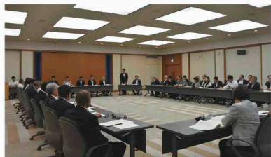
全議員検討会の様子(10月1日)

本計画では、災害発生時に、議長を本部長とする県議会災害対策本部を設置し、災害に関する情報を一元的に集約・管理する体制を構築することや議員の行動のあり方等を定めました。