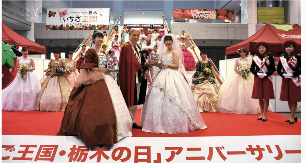
1月15日に議事堂で開催された「いちご王国・栃木の日」アニバーサリーフェアの様子 ※栃木県では、いちごの生産量が50年連続で日本一となったのを機に1月15日を「いちご王国・栃木の日」と宣言し、いちごを通じた本県の魅力のPRに取り組んでいます。