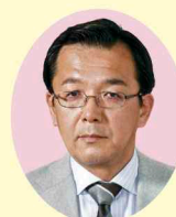
西村 しんじ (公明党) [小山市・野木町]