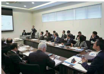
上三川町での調査の様子

○11月15日 電気自動車(EV)の現状と今後や燃料電池(FC)開発の取組について調査するため、上三川町と芳賀町を訪れました。また、芳賀町新産業団地の現地視察を行いました。