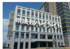
栃木県議会中継 検索

◇県議会ホームページでは、これまで放送した県議会広報テレビ番組を視聴できます。ぜひアクセスしてご覧ください。