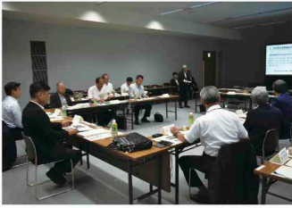
うきは市での調査の様子

福岡県福岡市において同県の人口減少対策や地方創生の取組について、同県うきは市において地域資源や人材を生かした地方創生の取組について調査を行いました。