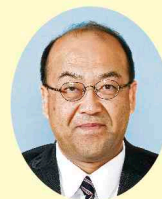
山口 恒夫 (公明党) [宇都宮市・上三川町]