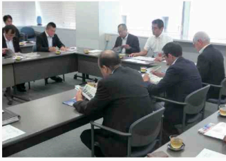
大阪市での調査の様子

兵庫県神戸市において温泉観光を核にしたブランド力向上等の取組について、大阪府大阪市において大手旅行会社の関西圏での個人・団体商品の販売動向等について調査を行いました。