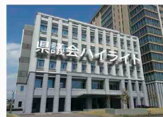
栃木県議会中継 検索

◇県議会ホームページでは、これまで放送した県議会広報テレビ番組を視聴できます。ぜひアクセスしてご覧ください。