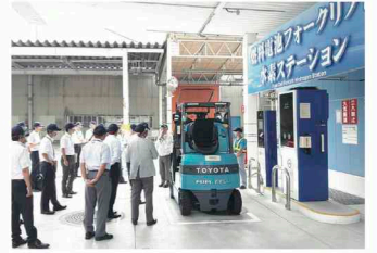
燃料電池フォークリフト・水素ステーションの視察

三重県伊賀市において大規模体験型農園の取組について、愛知県豊田市において燃料電池自動車(FCV)に関する取組について調査を行いました。