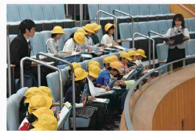
大田原市立親園小学校4年生の見学の様子(10月17日)

県では、小学生等の社会科見学や10名以上の団体の皆様を対象に、議会議事堂や県庁舎の見学案内を行っています。議事堂では、議会案内ビデオの視聴や、6階にある傍聴席から議場の見学ができます。