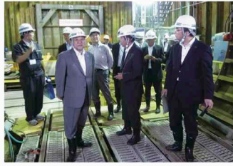
望月寒川放水路トンネル工事現場の視察

北海道札幌市において、道と民間旅行会社が連携したインフラツーリズムの取組や札幌市の都心まちづくりの取組について調査を行いました。