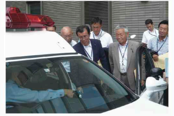
全方位カメラ搭載パトカーの視察

京都府京都市において府警察本部の通信指令システムについて、滋賀県甲賀市において県立高校再編に係る取組等について調査を行いました。