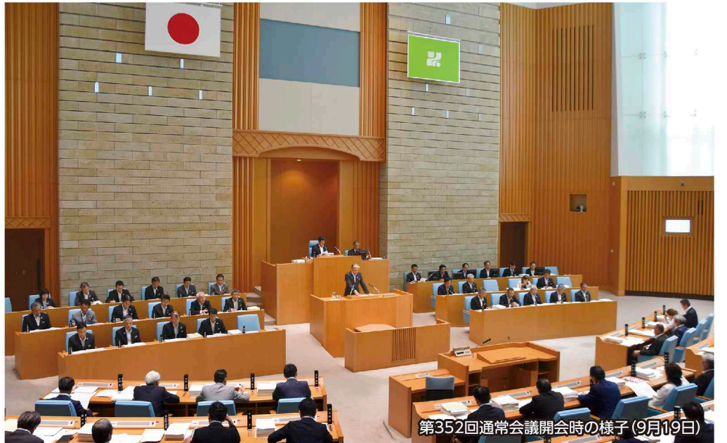
第352回通常会議開会時の様子(9月19日)