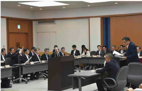
予算特別委員会 総括質疑の様子

○質疑者:7名(とちぎ自民党議員会2名、民主市民クラブ1名、公明党栃木県議会議員会1名、県民クラブ1名、さわやか未来クラブ1名、静和の会1名)