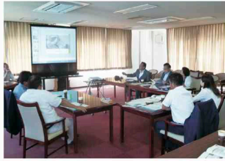
上田市での調査の様子

長野県佐久市、上田市、松本市において、医療機関が行う在宅医療等の取組や女性活躍推進に向けた企業の取組、地域包括ケアシステムの構築に向けた行政の取組について調査を行いました。