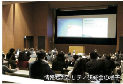
情報セキュリティ研修会の様子

合する方式を導入すること」「自治体クラウドの導入を促進すること」「情報セキュリティ対策の充実を図ること」など、3つの視点から提言しています。