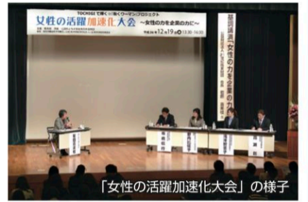
「女性の活躍加速化大会」の様子

民の参画の下で地域の実情に応じて地域包括ケアシステムが構築できるよう、県民及び関係者に構築の必要性について十分に普及啓発していくこと」など、5つの視点から提言しています。