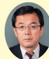
西村 しんじ (公明党)