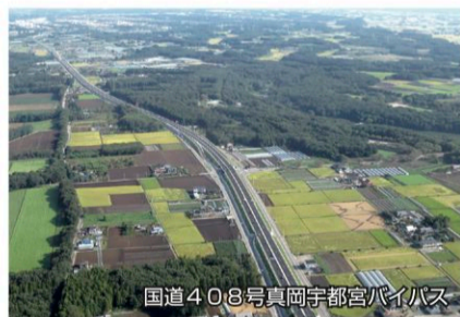
国道408号真岡宇都宮バイパス

の集積を推進し「とちぎのエコ・コンパクトシティ」の実現を図ること」など、地域経済の力強い成長を支える県土整備を進めるため、4つの視点から提言しています。