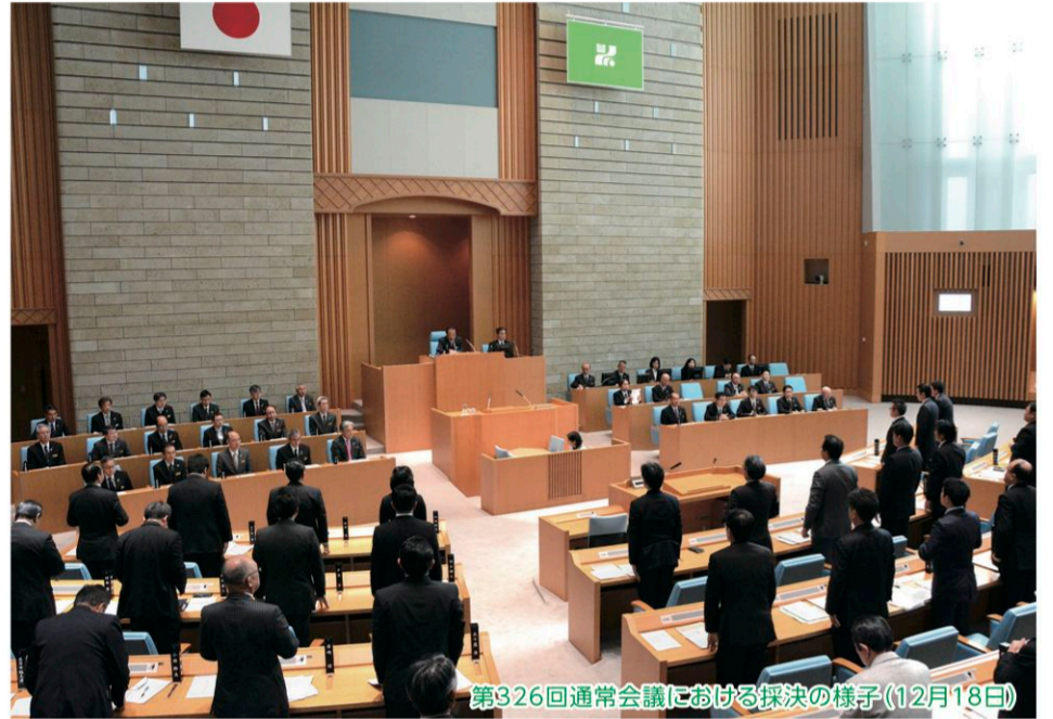
第326回通常会議における採決の様子(12月18日)