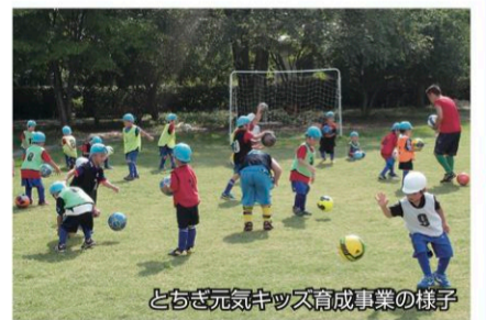
とちぎ元気キッズ育成事業の様子

予防・検挙活動の推進、少年を振り込め詐欺に加担させないための活動の推進について、9つの視点から提言しています。