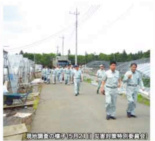
現地調査の様子(5月21日 災害対策特別委員会)