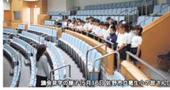
議会見学の様子(5月16日 佐野市立豊生小の皆さん)