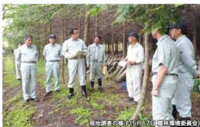
現地調査の様子(5月17日 農林環境委員会)

委員会をA、Bの2グループに分け、日をずらして開催することにより、県民の皆様が委員会を傍聴する機会がより増えることになりました。また、委員会を終日開催できるようにするなど、審議、現地調査時間を十分に確保しました。