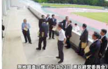
現地調査の様子(5月23日 県政経営委員会)