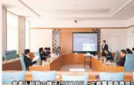
参考人招致の様子(5月18日 文教警察委員会)