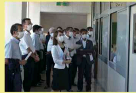
▲ICTを活用した授業を調査する委員

7月19日には、ICTを活用した授業の取組等について調査するため、県立烏山高等学校を視察しました。