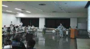
▲市町から要望箇所の説明を受ける委員

6月から7月にかけて県内市町の重点要望箇所の状況を把握するため、各市町との意見交換や現地視察を実施しました。