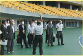
▲カンセキスタジアムを視察する委員

6月23日には、国体の開閉会式会場となる栃木県総合運動公園の状況等について調査するため、現地視察を実施しました。