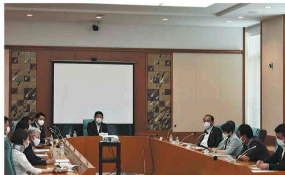
▲委員間討議を行う様子