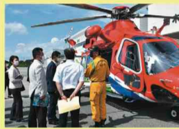
▲消防防災ヘリの説明を受ける委員

6月28日には、消防防災ヘリコプター「おおるり」の運行状況やPCR検査体制について調査するため、現地視察を実施しました。