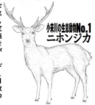
小来川の生息動物No.1 ニホンジカ

夜間は車のヘッドライトに目が反射し、お尻の毛が白くて目立つので交通事故防止の意識は高いのかもしれない。