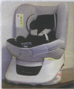
チャイルドシートの貸出しを無料で行っています。