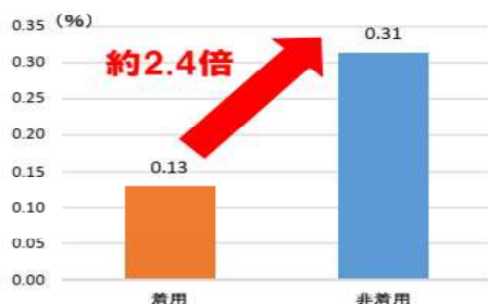
自転車乗用中死傷者におけるヘルメット着用状況別頭部致命傷率の比較【令和元年～令和5年合計】

（注）自転車乗用中死傷者に占める人身損傷主部位が「頭部」であった死者の構成率を比較したものである。