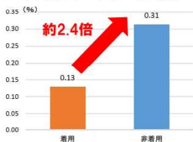
（注）自転車乗用中死傷者に占める人身損傷全部位が「頭部」であった死者の構成率を比較したものである。

自転車乗用中死傷者における ヘルメット着用状況別頭部致命傷率の比較 【令和元年～令和5年合計】