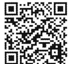
電子申請システム