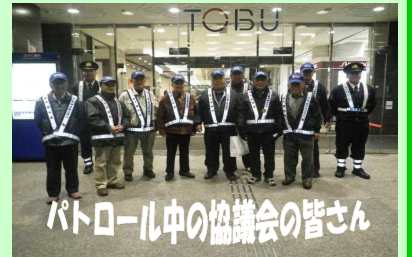
パトロール中の協議会の皆さん

万町交番では、地元有志者からなる「万町交番連絡協議会」の会員の方と共にパトロールを実施しております。不審者等を発見の際は、警察へ通報するよう、よろしくをお願いします。 ※現在、新会員募集中です。