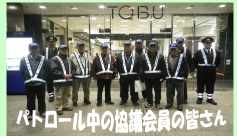
パトロール中の協議会員の皆さん

万町交番では、地元有志者からなる「万町交番連絡協議会」の会員の方と共にパトロールを実施しております。不審者等発見の際は、警察へ通報するよう、よろしくお願います。