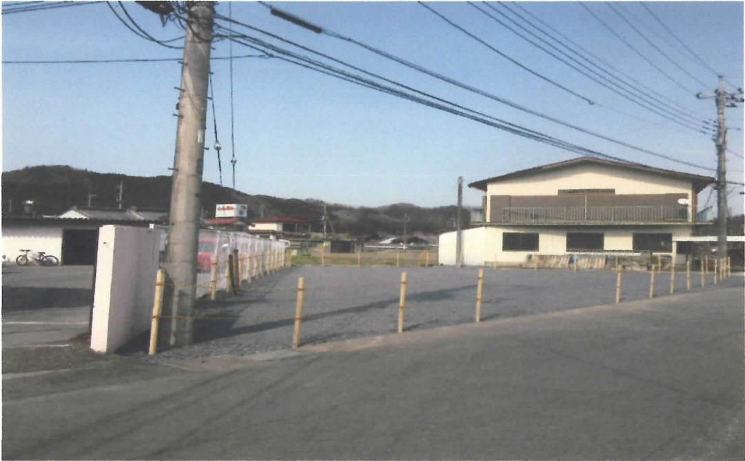
南 西 方 向 か ら 対 象 物 件 を 撮 影