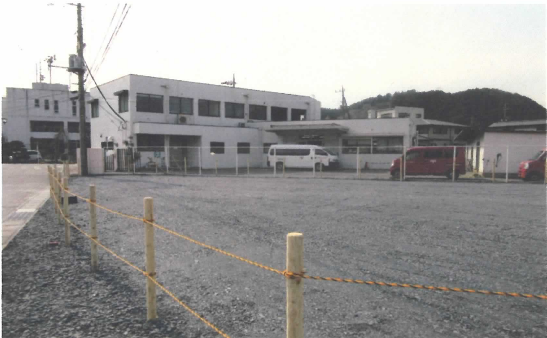
北 東 方 向 か ら 対 象 物 件 を 撮 影