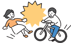
こうつうじこ 交通事故の発生やあお うんてん ひがい 煽り運転の被害