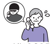
とくしゅさぎ ひがい 特殊詐欺被害