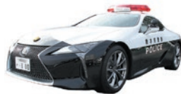
パトカー (レクサス)