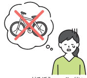
どろぼう ひがい 泥棒の被害

ばん きんきゅうじ 110番は緊急時のダイヤルです。けいさつかん 警察官にすぐ現場に駆けつけて欲しいときは、110番!