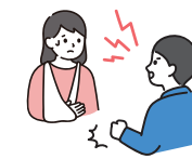
DV・ストーカーやちかんの被害