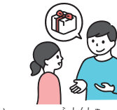
ふしんしゃ 不審者