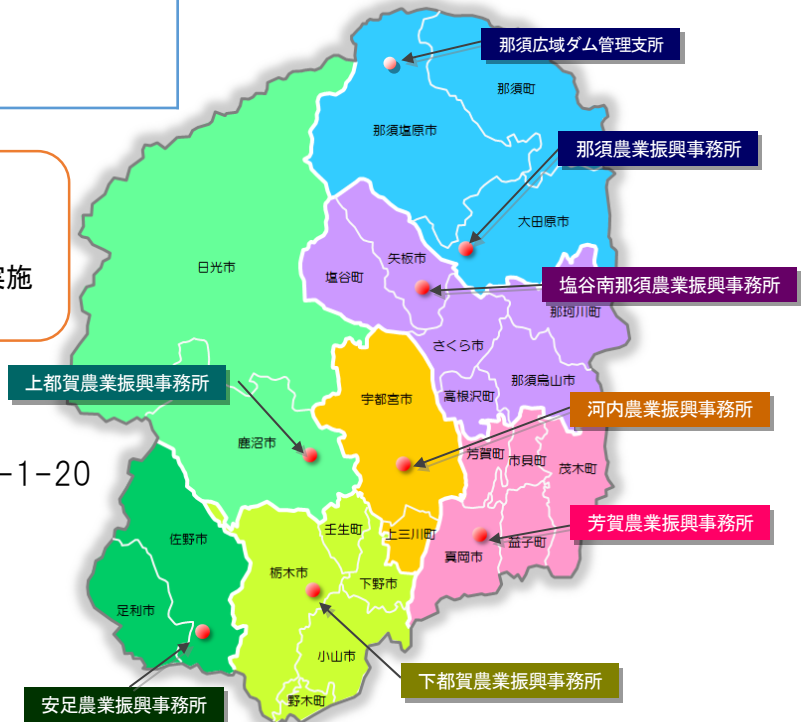
— 農業振興事務所の管内図 —