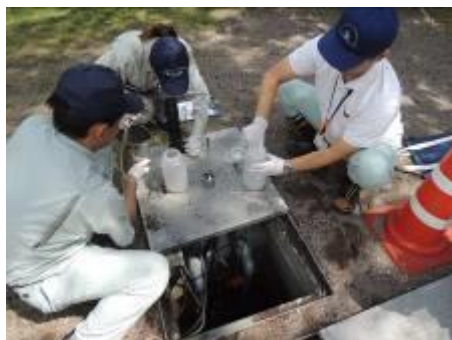
【立入工場での採水調査】

～良好な生活環境を保全し、限りある資源を有効に利用する社会づくり～（大気・水・土壌・地盤環境の保全等）