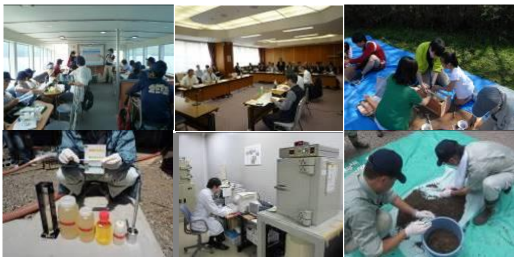
栃木県庁の化学職は様々な場所で活躍しています！