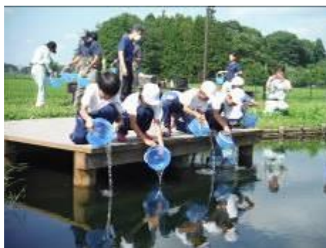
【ミヤコタナゴの放流】