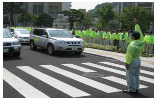
【不法投棄パトロール出発式】