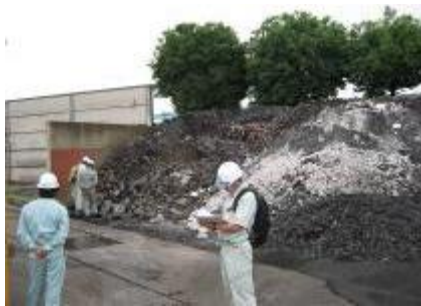
【産業廃棄物処理施設への立入調査】