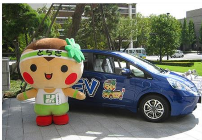
【EV（電気自動車）の県公用車】