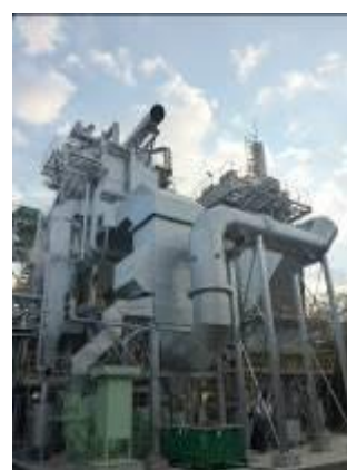
【木質バイオマスエネルギー利用施設】

温室効果ガス排出削減対策とエネルギー対策の一体的推進に向けて再生可能エネルギーの普及拡大や省エネルギー対策に向けた設備導入支援等を行っています。