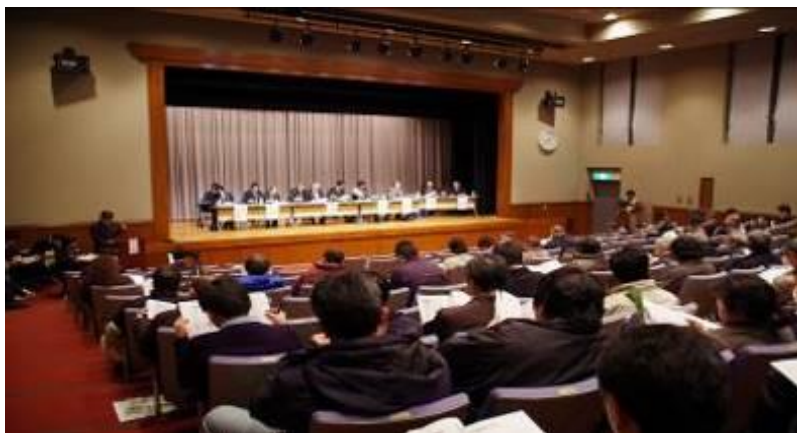
【県営最終処分場整備に係る住民説明会】

廃棄物処理施設は日常生活及び事業活動のために必要不可欠であり、適正な運営を指導するだけでなく、廃棄物・リサイクル産業の育成のために県民の皆さんの理解促進が必要です。