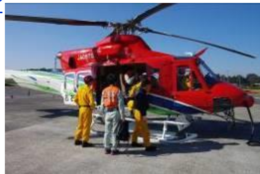
【産廃スカイパトロール】