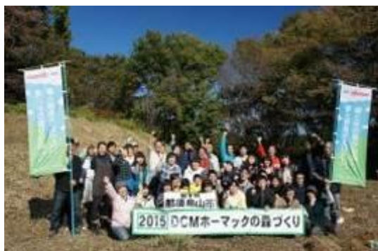
【企業との協働による森づくり】