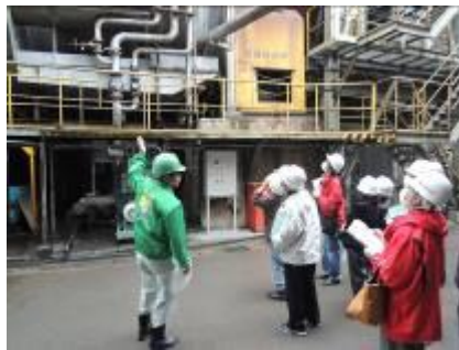
【産業廃棄物処理施設見学バスツアー】