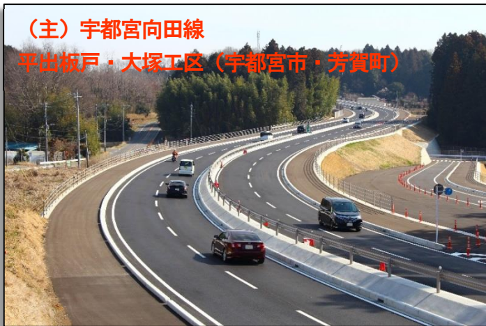
(主) 宇都宮向田線 平出板戸・大塚工区 (宇都宮市・芳賀町)