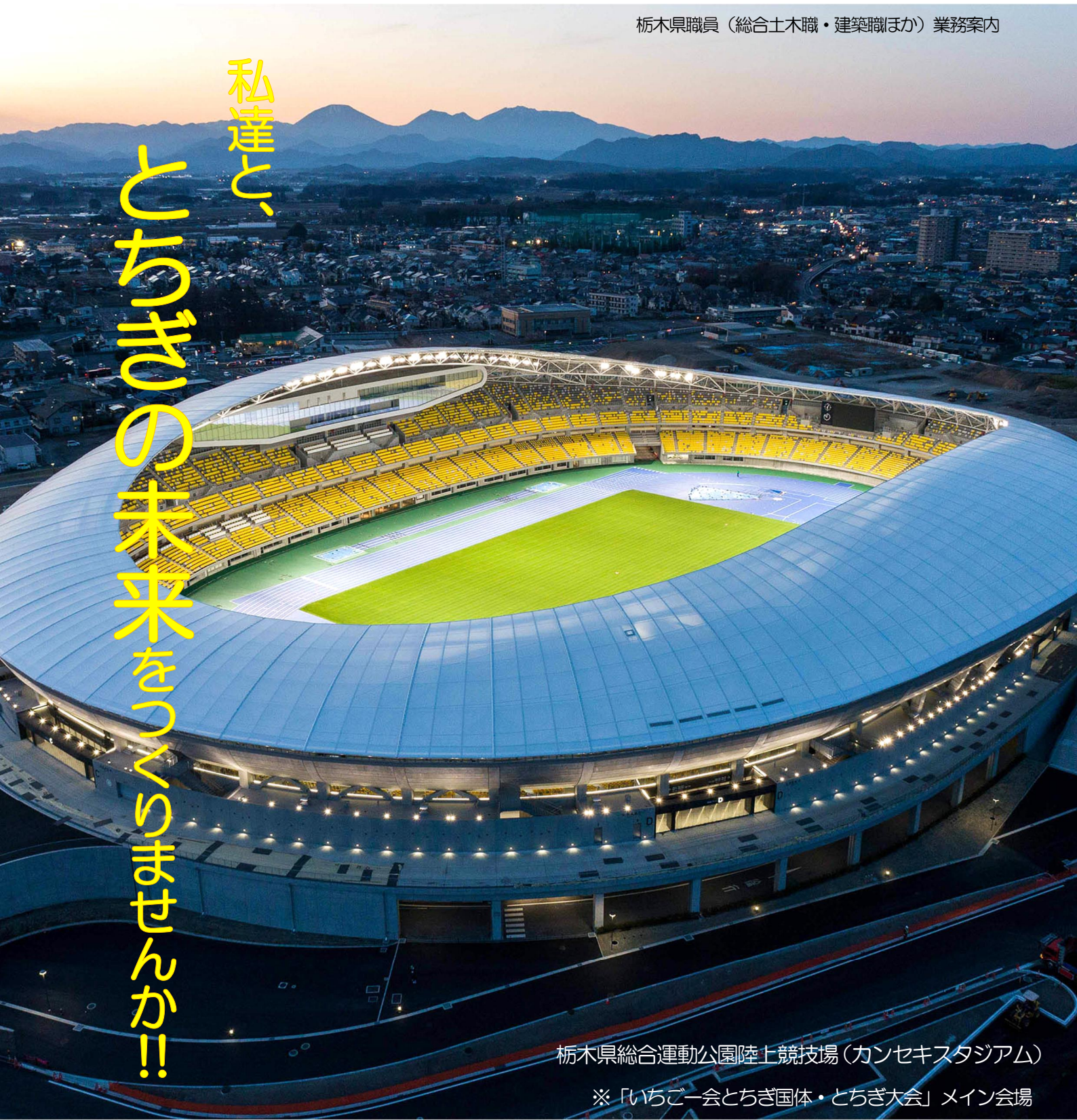
栃木県総合運動公園陸上競技場（カンセキスタジアム）