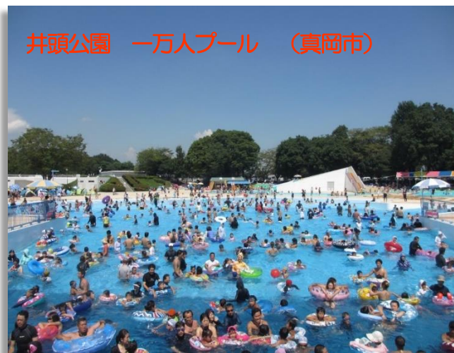
井頭公園 一万人プール (真岡市)