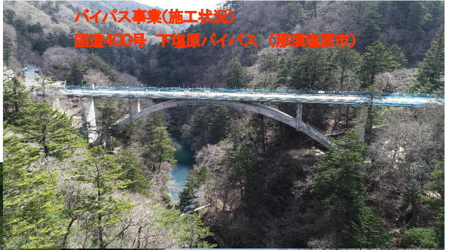
バイパス事業(施工状況) 国道400号 下塩原バイパス (那須塩原市)