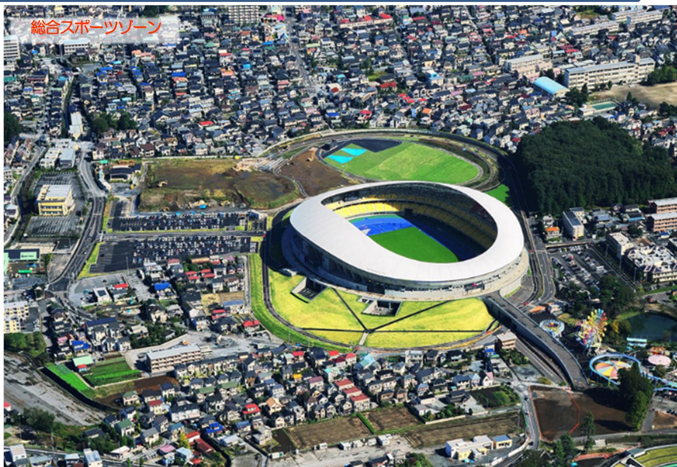
総合スポーツゾーン