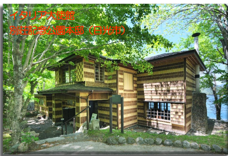
イタリア大使館 別荘記念公園本部 (日光市)