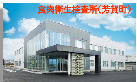
食肉衛生検査所(芳賀町)