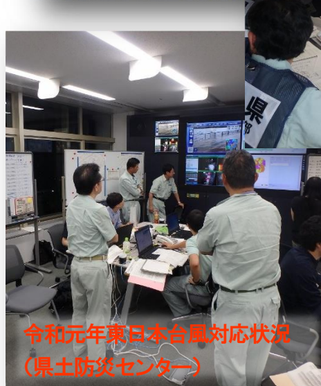
令和元年東日本台風対応状況 (県土防災センター)