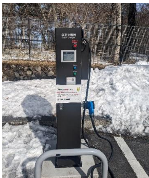
【華厳の滝第一駐車場】