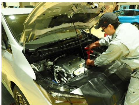
【電気自動車の整備風景】