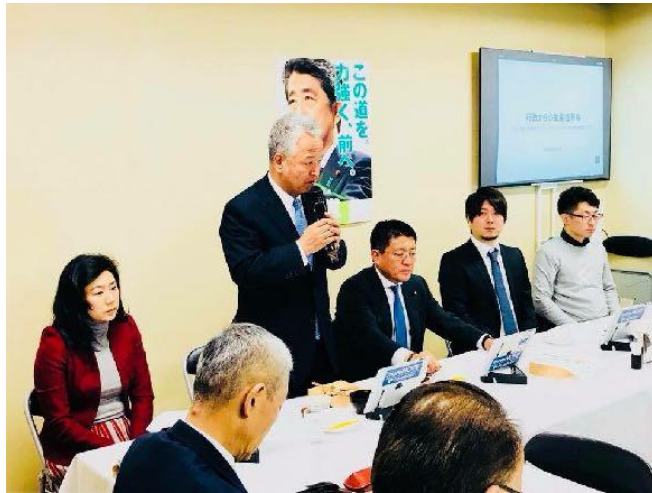
政府へのIT化戦略のご提言

日本の電子契約市場の立ち上がりを支え、政府へのIT化戦略のご提言を始めとし、電子契約の普及とともに、事業を成長させてきました。