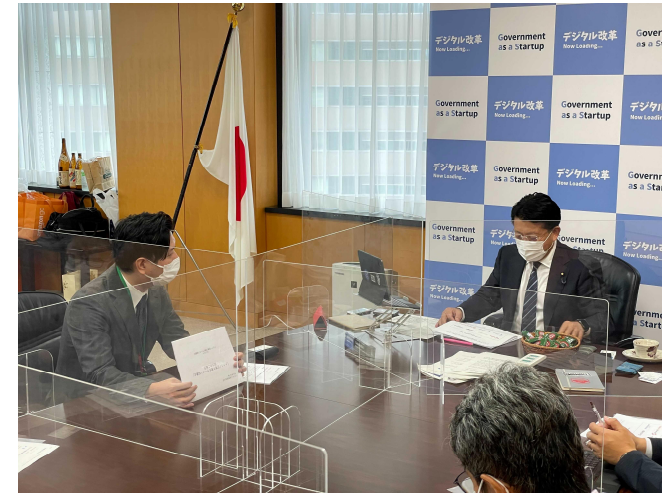
クラウド型電子署名サービス協議会の設立