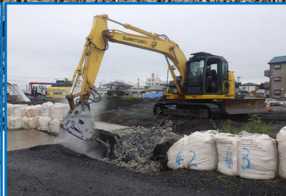
中橋下部工設置工事その5 山菊・朝日・篠崎特定JV 引堤箇所の解体作業を行っています。