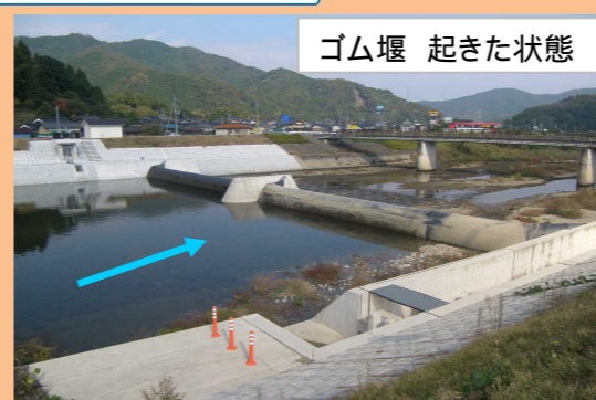
ゴム堰 起きた状態