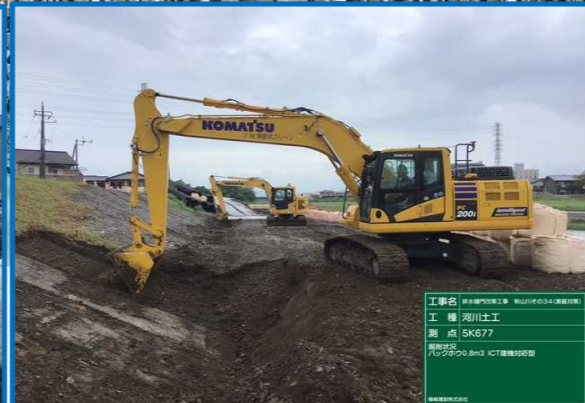
排水樋門改築工事その34 篠崎建設(株) コンクリートブロック設置前の掘削作業を行っています。