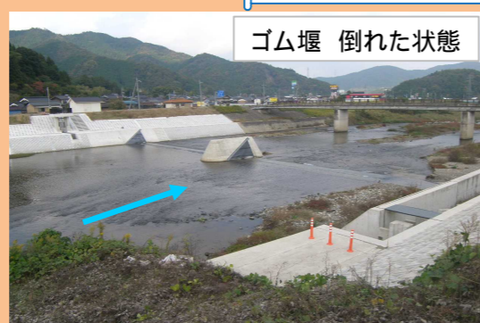
ゴム堰 倒れた状態