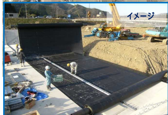
堰上部工設置工事秋山川その4 日東河川工業(株) 他の現場でゴムゲートの据付を行っているイメージ写真です。