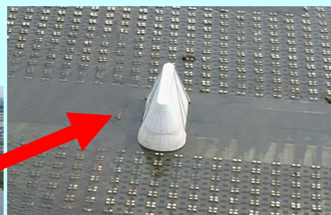
堰柱:ゲートの土台となる部分