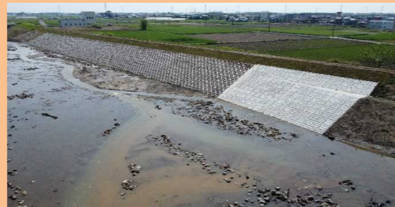
護岸工事 秋山川その1(安全川補)

本誌「秋山川工事だより」については、佐野ケーブルテレビの「さのニュース」でも取り上げられ、シリーズで放映されています。 過去の放映内容については、安足土木事務所のホームページや動画投稿サイト(YouTube)の『栃木県県土ちゃんねる』にてご覧いただくこともできます。