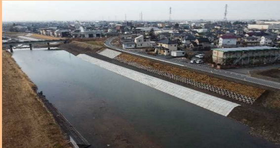
護岸工事 秋山川その26(激甚対策)