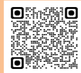
県土ちゃんねる QRコード

本誌「秋山川工事だより」については、佐野ケーブルテレビの「さのニュース」でも取り上げられ、シリーズで放映されています。 過去の放映内容については、安足土木事務所のホームページや動画投稿サイト(YouTube)の『栃木県県土ちゃんねる』にてご覧いただくこともできます。