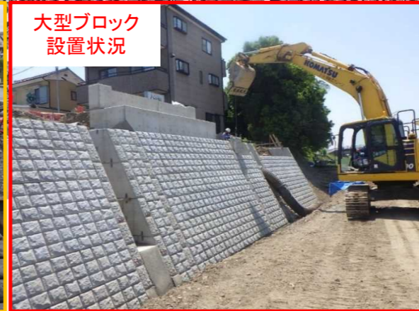
大型ブロック設置状況