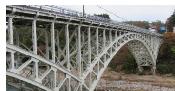
【参考】晩翠橋について

〔説明〕 那珂川の美しい翡翠色の流れと、翡翠(カワセミ)が飛来するほどの豊かな自然を表現した。