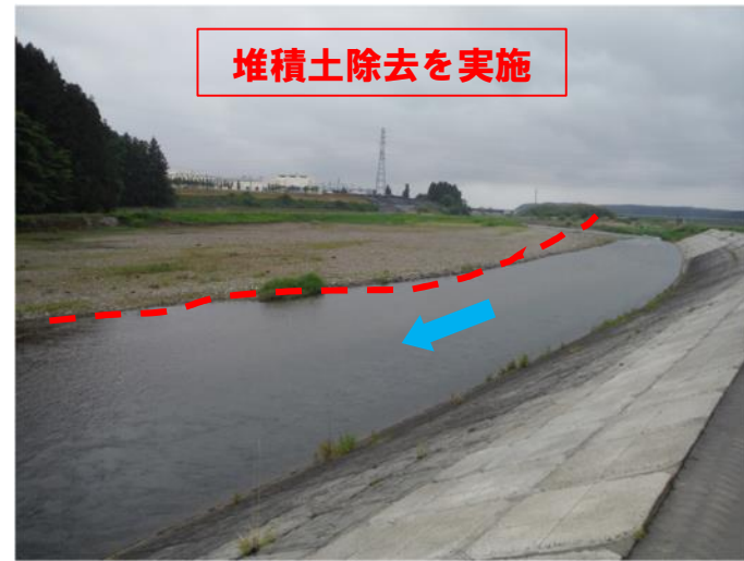
堆積土除去を実施