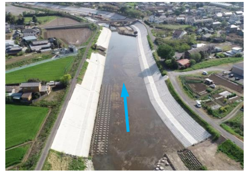
永野川 川谷橋上下流の状況 (R5.8月末) 時点