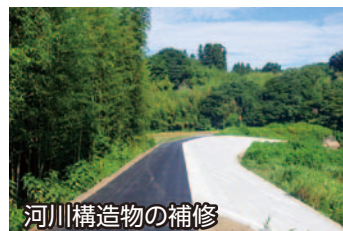
河川構造物の補修