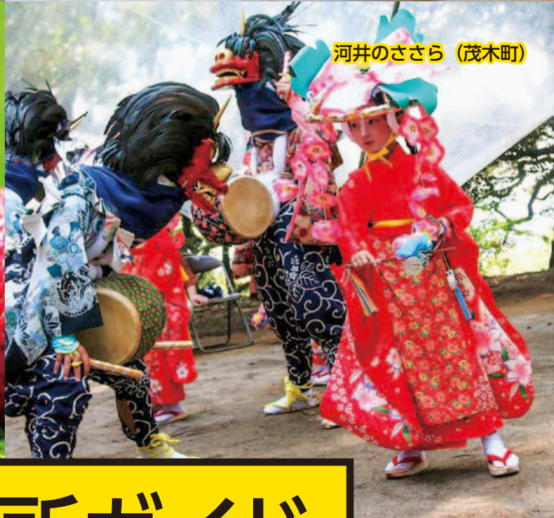
河井のささら (茂木町)