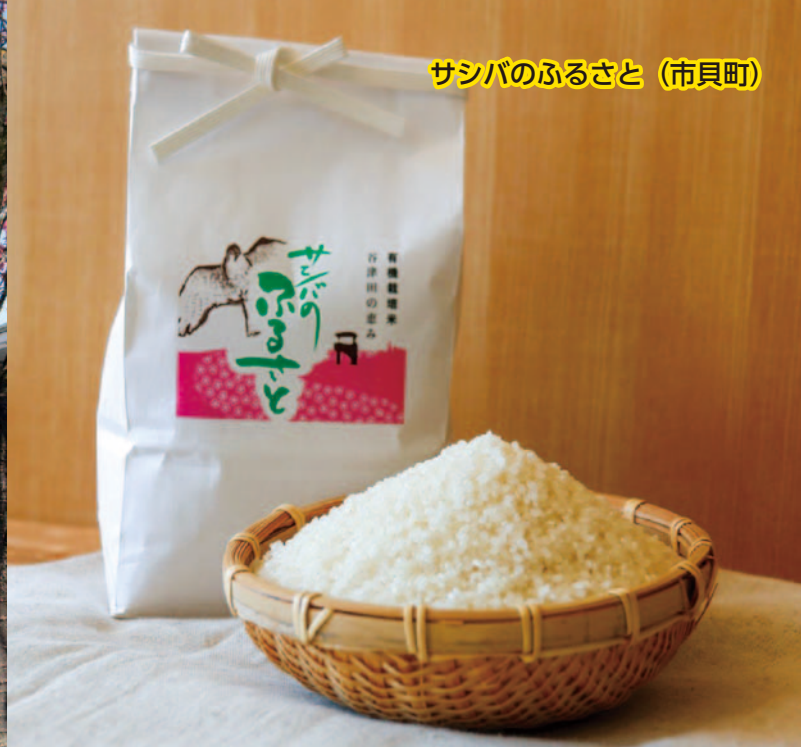
サンバのふるさと (市貝町)