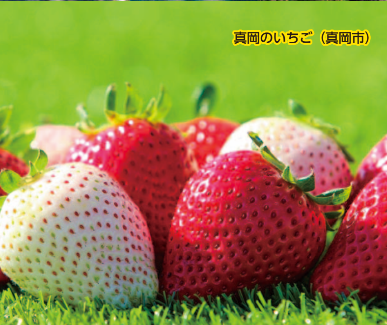
真岡のいちご (真岡市)