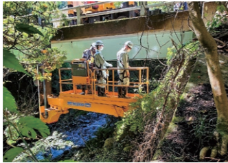
橋梁点検車による橋梁点検

第三者への被害や落橋等による長期機能不全を回避するために、定期的に点検を実施し、公共施設の現状把握に努めています。