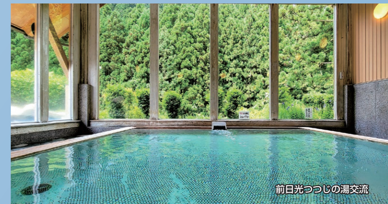
前日光つつじの湯交流