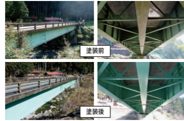
(例) 主要地方道草久足尾線 字穴橋の橋梁補修

橋梁等施設の現状を把握し、補修が必要な施設、劣化・損傷のある施設を速やかに補修し、長く安全に使用できるように予防保全に努めています。