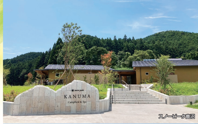
スノーピーク鹿沼

〒322-0068 栃木県鹿沼市今宮町1664-1 電話 0289-65-3211(代表) FAX 0289-65-3218 道路に関するご相談は 電話 0120-940-292 HPアドレス https://www.pref.tochigi.lg.jp/h52/