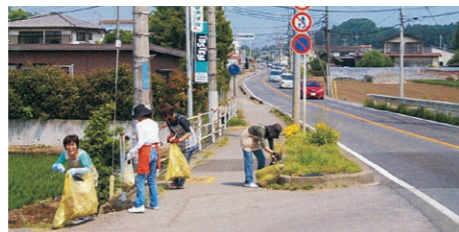
愛ロード活動風景▶

地域住民、学校、企業等のボランティア団体、市、県の三者が連携・協力し、安全で快適な道路・河川環境の維持向上を図るとともに、道路や川を愛する心をはぐくむため、清掃・美化活動を行っています。