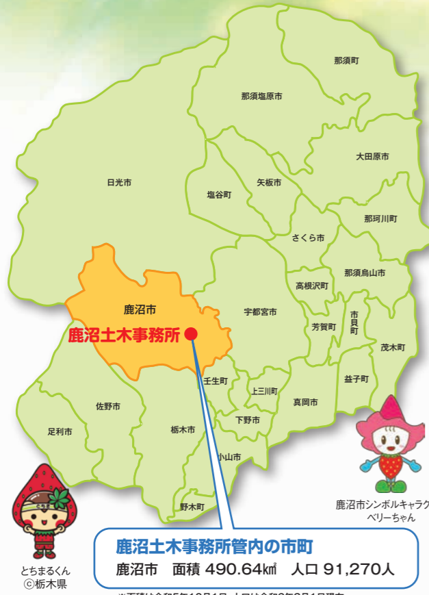
鹿沼土木事務所管内の市町