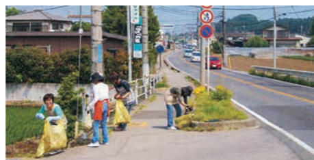
愛ロード活動風景▶

地域住民、学校、企業等のボランティア団体、市、県の三者が連携・協力し、安全で快適な道路・河川環境の維持向上を図るとともに、道路や川を愛する心をはぐくむため、清掃・美化活動を行っています。