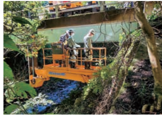
橋梁点検車による橋梁点検

第3者への被害や落橋等による長期機能不全を回避するために、定期的に点検を実施し、公共施設の現状把握に努めています。