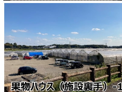
果物ハウス（施設裏手）-1