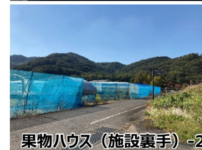
果物ハウス（施設裏手）-2