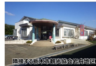
隣接する栃木市観光協会岩舟地区