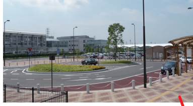
東口駅前広場 (平成23年3月完成)