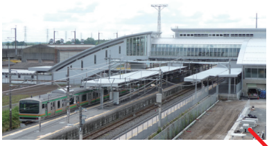
JR雀宮駅橋上駅舎 (平成23年3月完成)