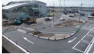
西口駅前広場 (平成24年10月完成)