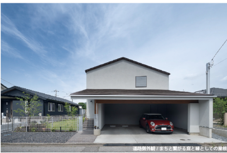
道路側外観 / まちと繋がる庭と縁としての屋根

敷地は「東の京都」、「北の鎌倉」と言われる栃木県足利市にあり、歴史の香り漂う街並みや史跡（足利学校・鏡阿寺等）が多く残っている。南には関東平野が広がり周囲は里山に囲まれ、とうとうと渡良瀬川が流れるのどかな街である。そんな周辺環境になじむ様に庭や住まいが閉鎖的にならず、積極的にまちとつながる様に配慮した。ガレージとアプローチ通路は建物と構造的に一体となった一枚の屋根を架け、通りに対して縁の様な役割を持たせた。