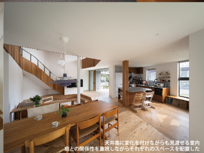
天井高に変化を付けながらも見逃せる室内庭との関係性を重視しながらそれぞれのスペースを配置した