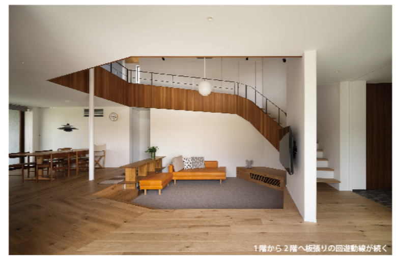
1階から2階へ板張りの回遊動線が続く

1階ではエントランスから直接アプローチするメイン動線とは別に家族のクローゼットを通りダイニングに通じるファミリー動線を設けている。また、吹抜けのあるリビングの周囲をリボンを巻くようにして、1階から2階までの個々のスペースをゆるやかにつなぐように回遊動線を設けた。回遊動線の壁は板張りとして他の珪藻土の白い壁と対比させ、デザイン的に強調させた。個性を持たせた個々のスペースをつなぎ、建物全体がダイナミックにつながる様にした。