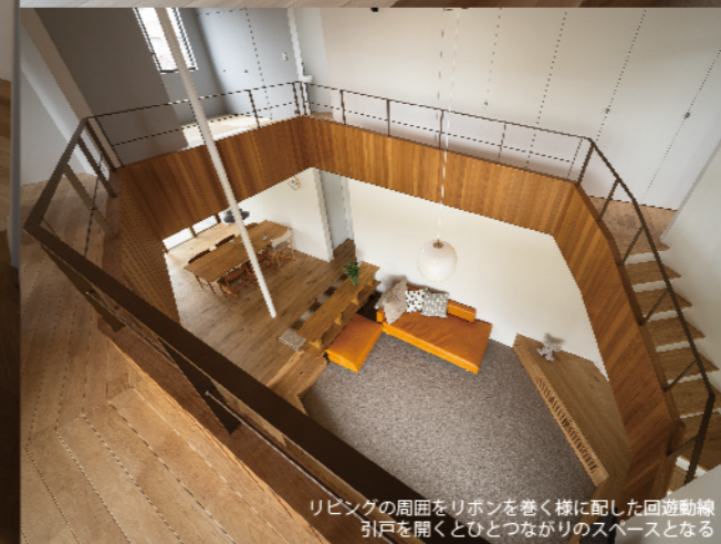
リビングの周囲をリボンを巻く様に配した回遊動線。引戸を開くとひとつつながりのスペースとなる