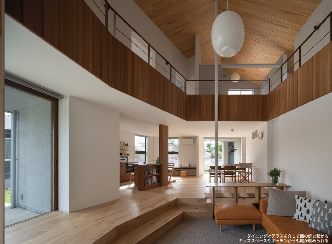
ダイニングはテラスを介して西の庭と繋がるキッズスペースやキッチンからも庭が眺められる